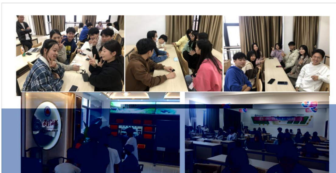
中国东盟贸易选拔赛现场